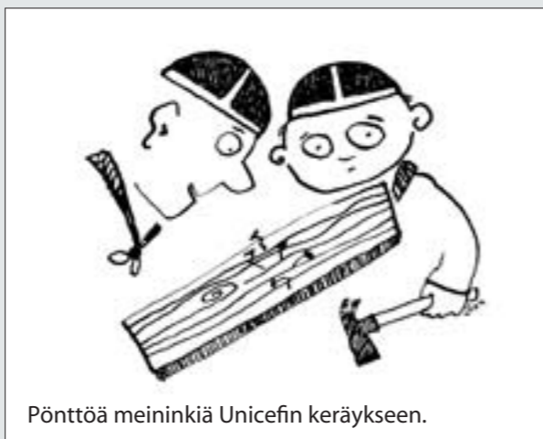
Pönttöä meininkiä Unicefin keräykseen.